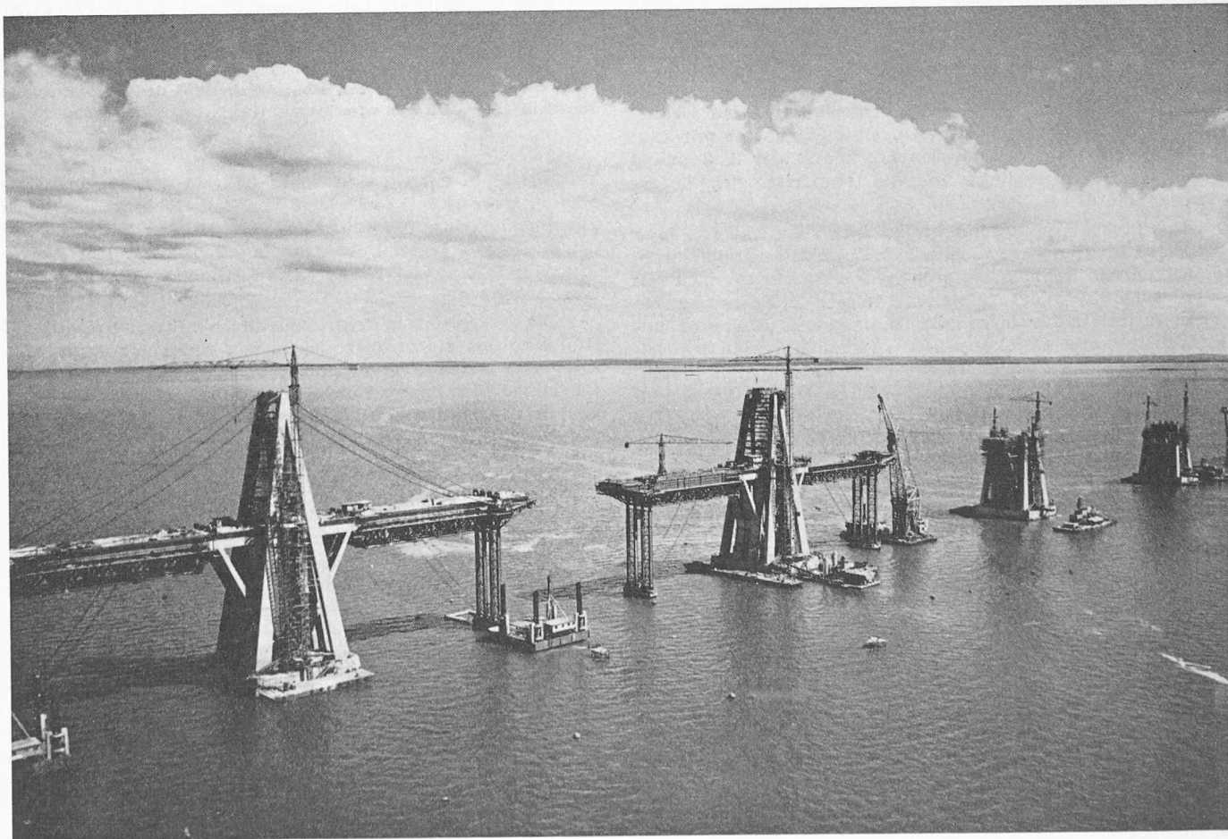
Bild 1. Brücke über den Maracaibo-See, Bauzustände von je 235 m. Die beidseits der Stützenkonstruktion auskragenden Auslegerbalken wurden auf provisorisch abgestützten Schalungsträgern betoniert, da sie erst durch das Spannen der Hängekabel ihre Tragfunktion erhielten

Die von Barcelona nach Nordwesten zu bauende Autobahn zur Erschliessung neuen städtischen Ausbreitungsgebietes unterfährt den 530 m hohen Bergzug des Tibidabo in einem Doppel-Tunnel von 2,4 km Länge. Es stehen hier steil einfallende metamorphe Schiefer des Silurs an, die von Quarzporphyr-Schloten durchzogen sind und ein standfestes Gebirge gewährleisten. Auf Grund dieser geologischen und der topographischen Verhältnisse wurde man zur Entwick-