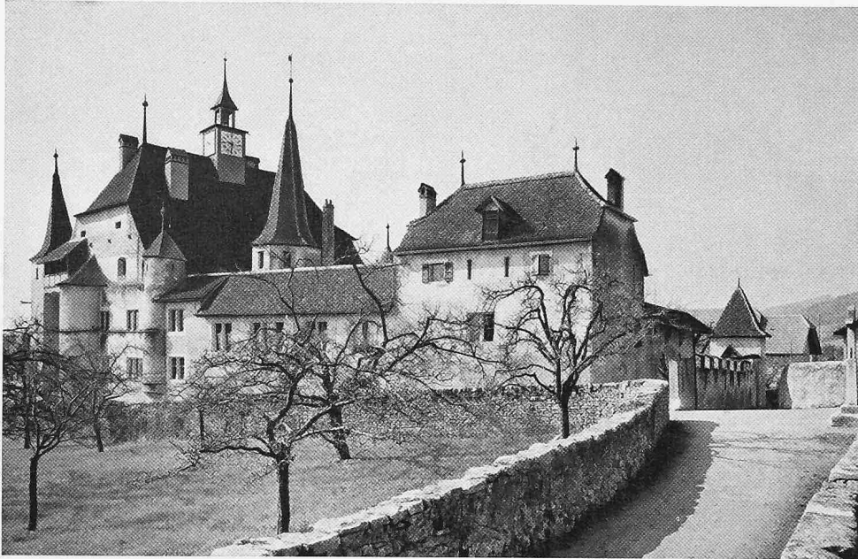
Cressier. Le château et ses annexes vus du nord-est (page 123)