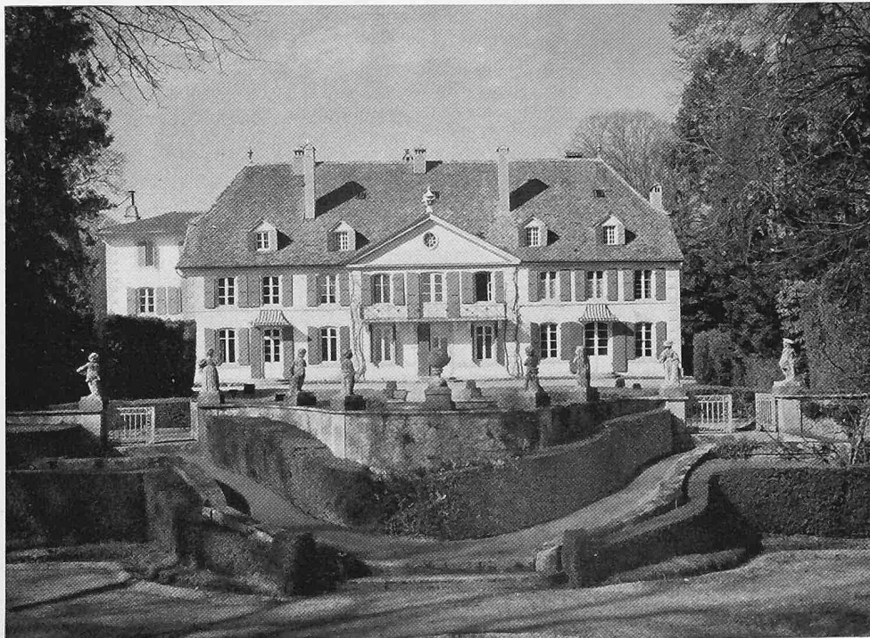
Colombier. Le Bied. La maison et le jardin vus de l'est (page 327)