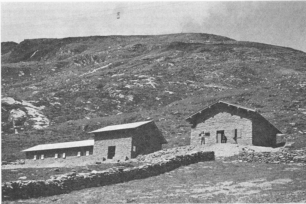
Bild 2. Die neue, über dem Stausee zweckmässig eingerichtete Alp Mulacetto im Valle di Lei

nung befürchten einen Einbruch in die Eigentumsгарantie und weisen darauf hin, dass unser Land das Allgemeinwohl vor allem der Freiheit in der Wirtschaft zu verdanken habe. Hören wir demgegenüber einen Befürworter der Raumordnung in der Person von Prof. Emil Küng, St. Gallen. Er schreibt: