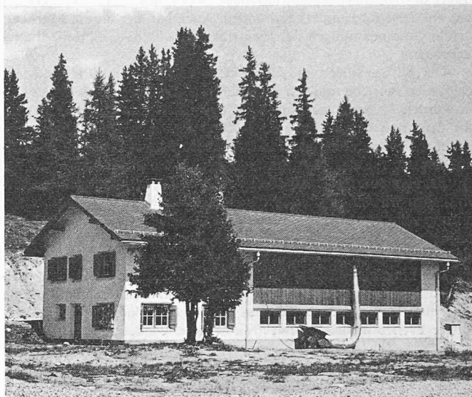
Bild 5. Eine der fünf Einheiten in Susauna, bestehend je aus Wohnhaus und Oekonomiegebäude

Unsere Aufgabe ist es nun, in den beiden Zonen eine landwirtschaftliche bzw. eine Bauland-Umlegung mit Quartierplan durchzuführen und bis zur Aufstellung einer Bauordnung mitzuwirken. Die so geschaffene Ordnung in der Bodenbeanspruchung kann sich für