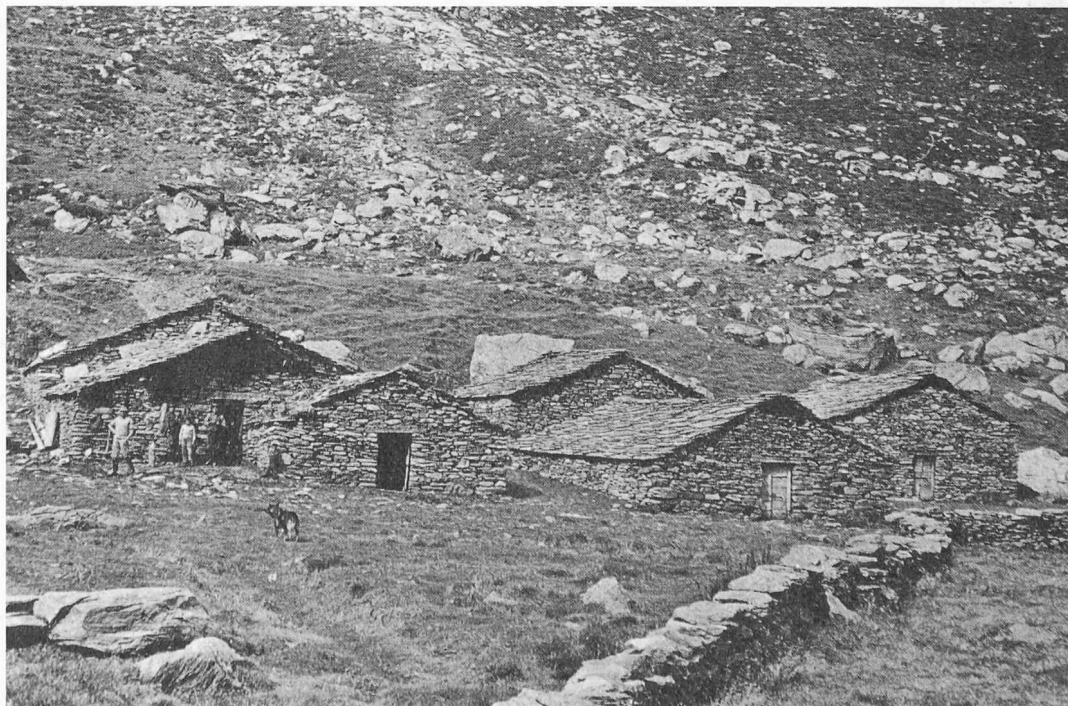
Bild 1. Alphütten Motalla im Valle di Lei, die durch den Stau untergingen

Diese Hinweise sollen dartun, wie notwendig es ist, den Bestrebungen der Orts- und Regionalplanung sowie jenen für ein neues Bodenrecht zum Durchbruch zu verhelfen. Beide Bestrebungen haben eine Raumordnung zum Ziel, bei der das freie Verfügungsrecht über Grund und Boden in dem Masse eingeschränkt werden soll, als dies für das Gesamtwohl unerlässlich ist. Über Freiheit und Planung sind die Juristen noch geteilter Meinung. Die Verneiner einer Raumord-