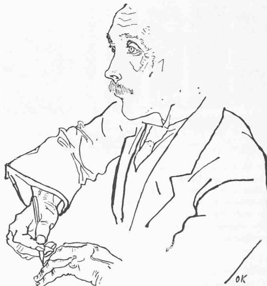
Porträtstudie Adolf Loos von Oskar Kokoschka (1910 im «Sturm» erschienen)