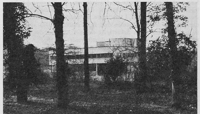
Villa Savoie von Westen gesehen (heutiger Zustand)

«Die Architekturabteilung der Eidgenössischen Technischen Hochschule in Zürich, deren Studenten, zusammengeschlossen in der « Architettura », sowie die Teilnehmer an der Gedenkfeier für Le Corbusier