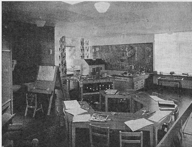
Prototyp eines Unterstufe-Klassenraumes des an der Triennale 1960 in Mailand gezeigten Schulpavillons (SBZ 1964, Heft 28, Seite 493). Der Klassenzimmergrundriss ermöglicht — unterstützt durch die vielseitige Belichtung — jede Art des Unterrichtes. Der Bau ist mit standardisierten Elementen erstellt (System CLASP)

ist. Auch dürften sie bei uns der hohen Stahlpreise wegen kaum konkurrenzfähig sein.