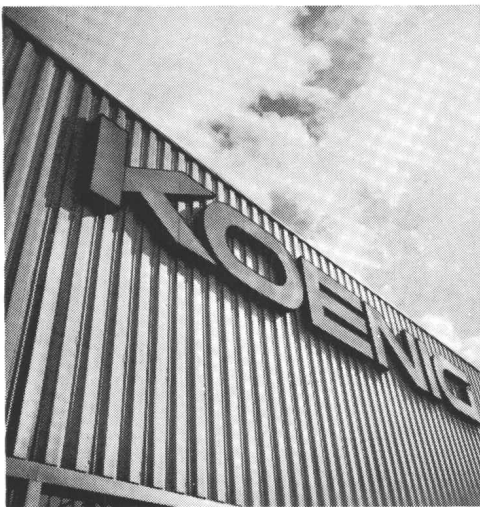
für Fassaden und Bedachungen