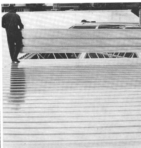
für Flachdächer und Decken

für Tunnel-Auskleidungen und Verkleidungen aller Art (Nationalstrasse N2, Lopper-Tunnels bei Hergiswil)