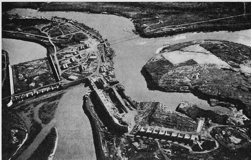
Rechtsufrige Hochwasserentlastung des Kraftwerks Cachoeira Dourada für Q = 6000 \text{ m}^3/\text{s} (max. Hochwasser 16\,000 \text{ m}^3/\text{s} )