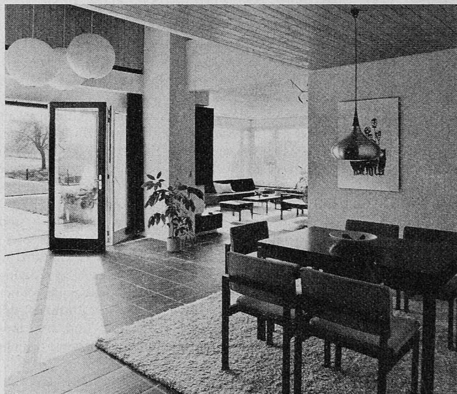
Wohnraum. Blick von der Essnische gegen das Cheminée und den Wohnteil

Für das Bauvorhaben stand ein nach Westen leicht abfallendes Grundstück zur Verfügung. Um den störenden Einwirkungen der Strasse zu begegnen und die Aussichtslage zu verbessern, wurde das Erdgeschoss höher als das gewachsene Terrain gelegt. Das Untergeschoss übernimmt die Funktion einer Stützmauer gegen die Strasse. Ein vertikaler Ausläufer, der als Flachdachkörper ausgebildet ist, dient dem Pultdach als Auflager. Des nach Norden freiliegende Kellergeschoss ermöglicht eine günstige Garageinfahrt für zwei Personenwagen.