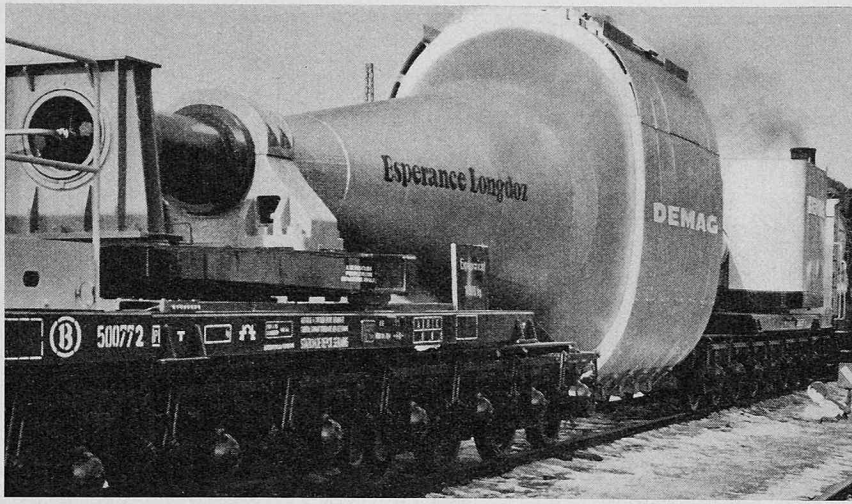
Bild 1. Ansicht des Roheisen-Mischerwagens während einer Versuchsfahrt