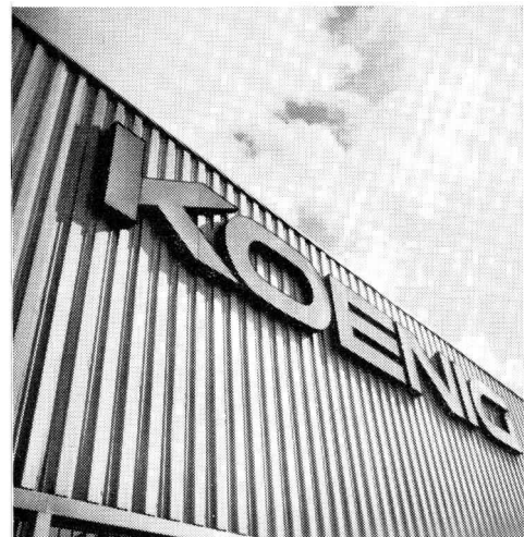
für Fassaden und Bedachungen