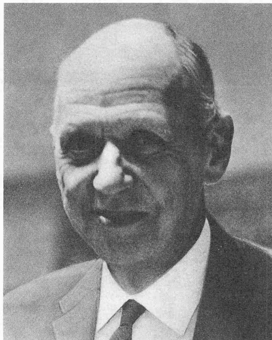
Professor Dr. J. Ackeret