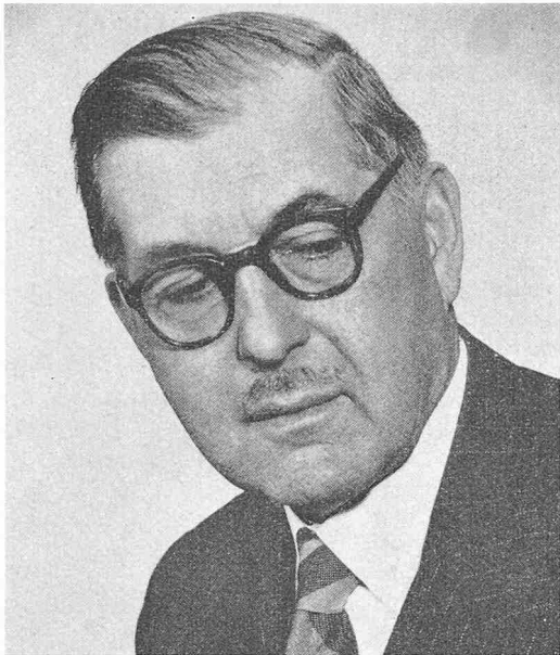
† Karl Kobelt

Dr. sc. techn., Bundesrat 1940—1954 1891 — 1968