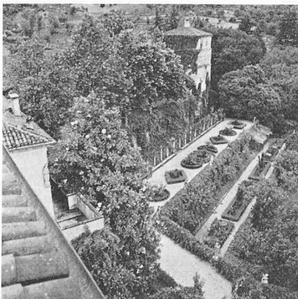
Villa Godi. Blick vom Herrenhaus auf den Giardino segreto und das Taubenhaus