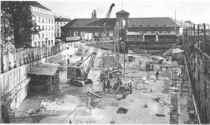
Bild 19. Blick gegen Bahnhof Enge. Umschliessungswand erstellt. Reihen der Entlastungsdrains als Stützen sichtbar. Seite Gutenbergstrasse (links im Bilde) verankerte Rühlwand

den Aushub der Baugrube entgegen. Der Vergleich der Spannungen aus diesen beiden Belastungsänderungen zeigt, dass in der umspundeten Baugrube diese beiden Einflüsse sich fast die Waage halten. In der Baugrube mit Entlastungsdrains, bei welcher die Belastung ausserhalb der Baugrube aus der Sickerströmung grösser ist als in jener, treten dagegen zusätzliche Belastungen in diesem Bereich auf. Infolge der erzwungenen Strömung gegen den Drain hin treten die zusätzlichen, vertikalen Spannungen aber erst im grösseren Abstände von der Baugrube auf.