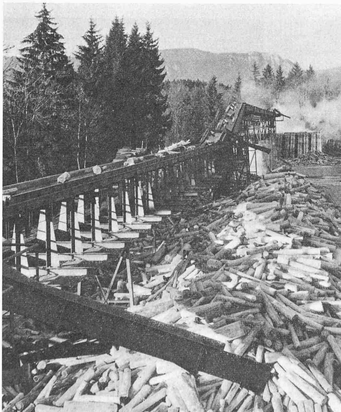
Bild 2. Teilansicht einer 170 m langen Förderanlage für Papierholz in einer Papierfabrik

bewegt und einer Waage zugeführt. Die Steuerung ist programmiert, die Anlage arbeitet also vollautomatisch.