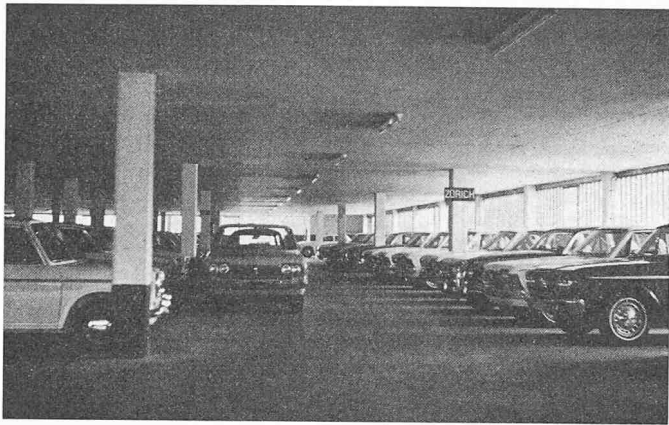
Bild 3. Innenansicht Erdgeschoss