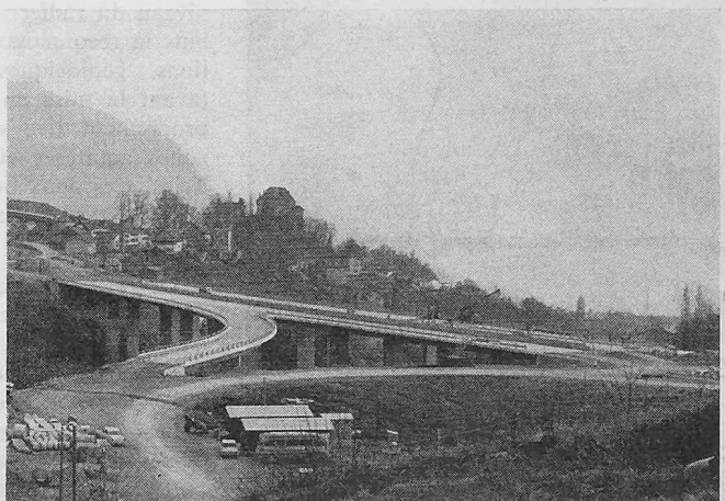
Pont sur la Baye de Clarens

L'ensemble des différentes caractéristiques géométriques du tablier se présente ainsi: