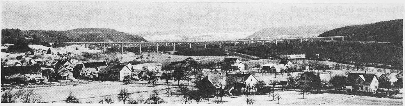
Das Aaretal mit der Hochbrücke bei Brugg, von Villnachern aus gesehen (Photomontage)