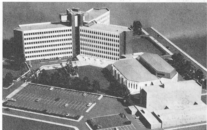
Bild 1. Modellaufnahme des Bürogebäudes mit Eigenbeheizung. Bauherr: Merseyside and North Wales Electricity Board; Architekten: Stroud, Nullis & Partners, London; Bauunternehmer: J. Jarvis & Sons Ltd., London