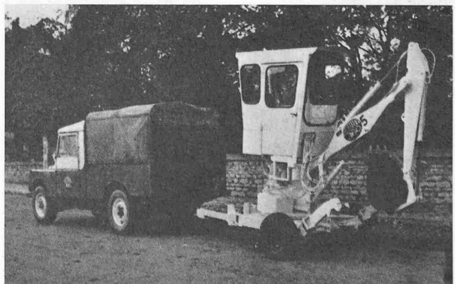
Bild 1. Der Smalley-Bagger 360/5 ist transportbereit

Man suchte nach einem einfachen und billigen mechanischen Hilfsmittel, welches auch für andere Zwecke einsetzbar sein sollte. Man fand es schliesslich in einem Klein-Hydraulikbagger britischer Herkunft, der neben einfach-