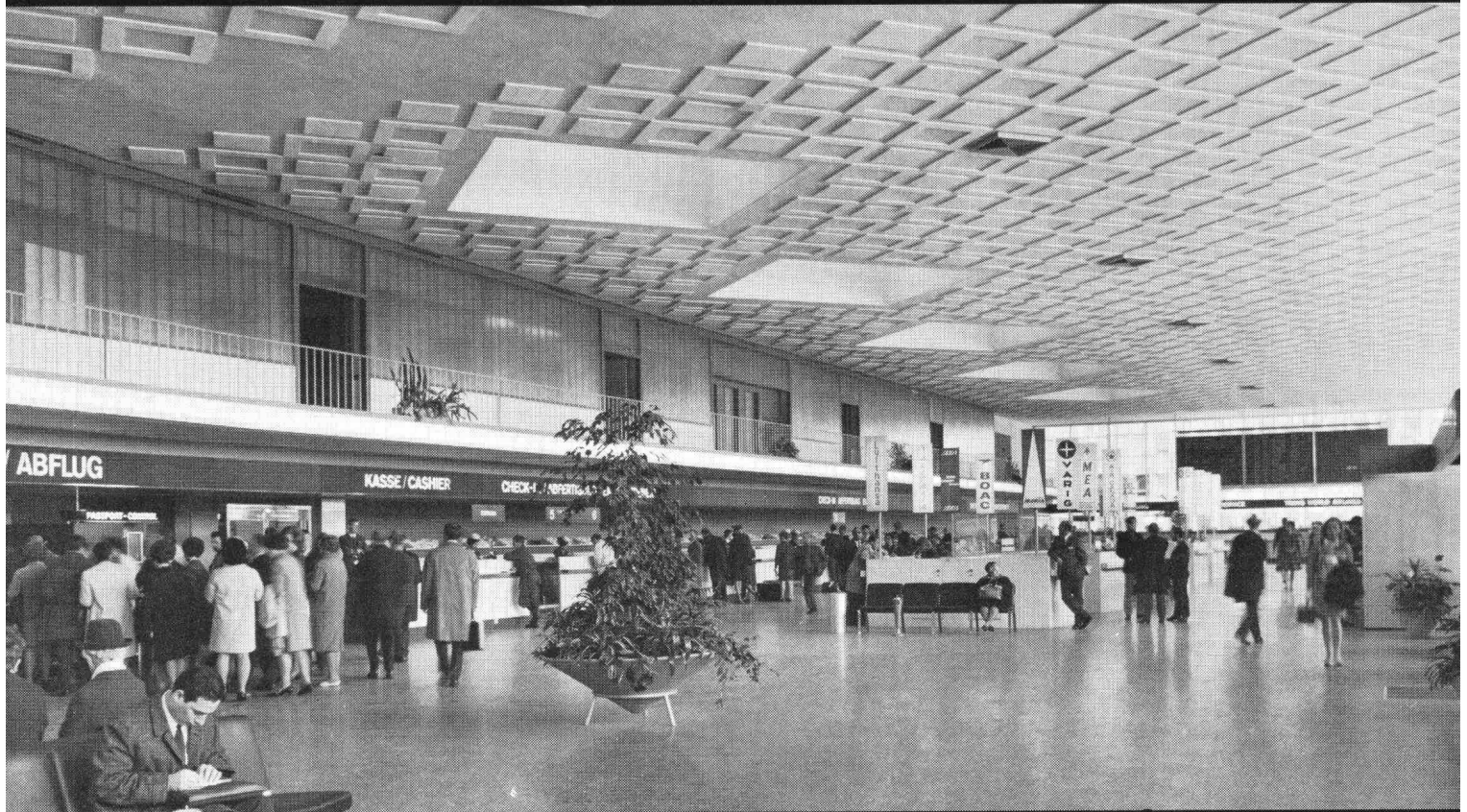
Flughafen Zürich Abflughalle Trakt Nord Bauleitung: Flughafen-Immobilien-Gesellschaft, Zürich