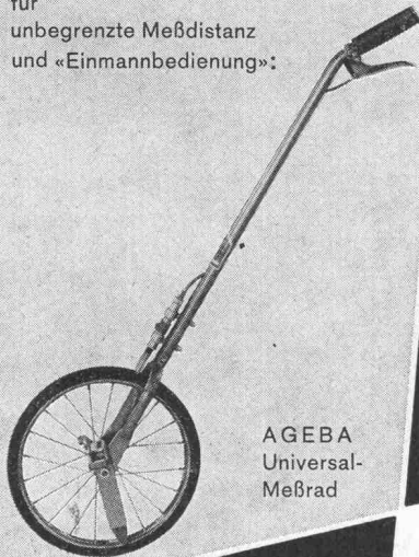
AGEBA Universal- Meßrad

für unbegrenzte Meßdistanz und «Einmannbedienung»: