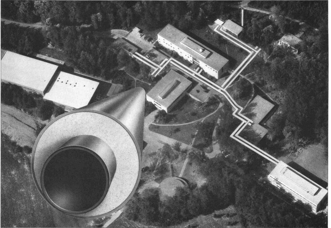
Mit Hartmoltopren verlegte Rohre beim Max-Planck-Institut für Kernphysik in Heidelberg. Freigegeben durch Regierungspräsidium Nordbaden Nr. 10/2233.