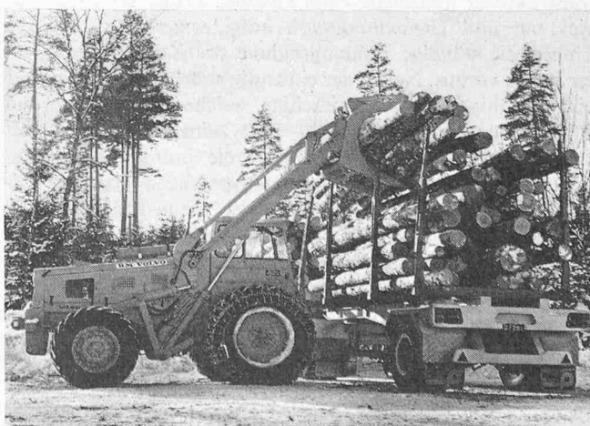
Bild 2. Lader Typ LM 840 ausgerüstet mit einem Sonder-Kippgreifer für Rundholz, Rohre usw.

staunlich. Noch 1961 belief sich der gesamte Umsatz von BM-Volvo auf 260 Mio Kronen, was ungefähr 194,4 Mio Fr. entspricht. Der Anteil des Exportes betrug damals rund ein Viertel der gesamten Produktion. Das Geschäftsjahr 1969 konnte mit einem Umsatz von 470,4 Mio Fr. abgeschlossen werden; in diesem Jahr belief sich der Anteil des Exportes auf 260 Mio Fr., also bereits rund 53 % des gesamten Umsatzes. Bolinder-Munktell hofft, bis 1975 die 1-Mia-Kronen-Grenze überschreiten zu können, wobei praktisch die ganze zusätzliche Produktion – man rechnet vor allem mit einem Anstieg auf den Sektoren Bau- und Forstmaschinen – im Ausland müsste abgesetzt werden können.