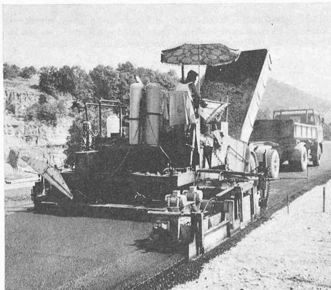
Bild 1. Elektrohydraulisch gesteuerter Fertiger im Einsatz. Im Vordergrund ist die Abtast-Steuereinrichtung sichtbar

Der Aufbau von Heissmischtragschichten besteht zu rund 96 Gew. % aus kornabgestuften Gesteinskomponenten und zu rund 4 % aus hochviskosem, bituminösem Bindemittel. Die genaue Zusammensetzung erfolgt auf Grund