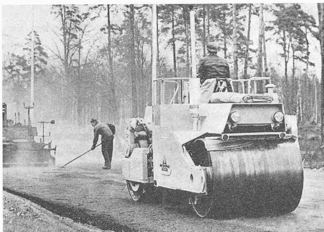
Bild 1. Die Vibrationswalze Dynapac CC-40 der AB Vibro Verken im Einsatz

Das ständige Ansteigen der Verkehrsdichte, der Geschwindigkeit und des Gewichtes der Verkehrsmittel stellt grosse Anforderungen an den Bau von Strassen, Flugplätzen usw. Die Vergebung von längeren und grösseren Baulosen gestattet den wirtschaftlichen Einsatz von grossen und leistungsfähigen Strassenanfertigern.