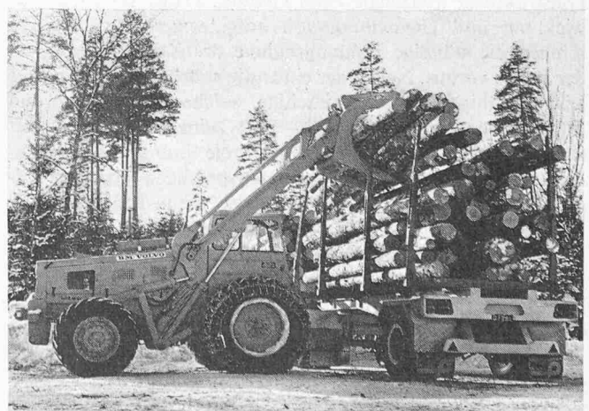
Bild 2. Lader Typ LM 840 ausgerüstet mit einem Sonder-Kippgreifer für Rundholz, Rohre usw.

staunlich. Noch 1961 belief sich der gesamte Umsatz von BM-Volvo auf 260 Mio Kronen, was ungefähr 194,4 Mio Fr. entspricht. Der Anteil des Exportes betrug damals rund ein Viertel der gesamten Produktion. Das Geschäftsjahr 1969 konnte mit einem Umsatz von 470,4 Mio Fr. abgeschlossen werden; in diesem Jahr belief sich der Anteil des Exportes auf 260 Mio Fr., also bereits rund 53 % des gesamten Umsatzes. Bolinder-Munktell hofft, bis 1975 die 1-Mia-Kronen-Grenze überschreiten zu können, wobei praktisch die ganze zusätzliche Produktion – man rechnet vor allem mit einem Anstieg auf den Sektoren Bau- und Forstmaschinen – im Ausland müsste abgesetzt werden können.