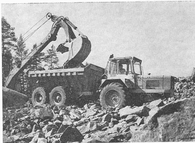
Bild 4. Muldenkipper Typ DR 860 im Einsatz. Leergewicht 12,3 t, Muldeninhalt 10,5 m 3 , Motorleistung 110 PS bei 2400 U/min

Unter diesen Zusatzgeräten findet sich naturgemäss eine lange Reihe von Schaufeln (gerade oder spitze Vorderkante, mit oder ohne Zähne, Sonderschaufeln für Holzschnitzel, Beton, Bruchstein usw.). Doch auch Gabelstaplervorsätze, verschiedenartige Spezialgreifer für Rundholz (Bild 2), Faserholz, Rohre, Schrott usw. sowie Kranausleger, Ballengreifer, Container-Wender, Kehrmaschinen, Schneepflüge, Diagonalschare usw. machen die Maschine äusserst vielseitig verwendbar. Das Auswechseln der Geräte erfordert meist kaum eine Minute, und der Fahrer braucht dazu seine Kabine oftmals gar nicht zu verlassen. Zu diesem grossen Programm von Zusatzgeräten werden in absehbarer Zeit noch fünf neue kommen: 1. Gabel, die es erlaubt, Paletten bis zu einer Höhe von 7 m zu stapeln; 2. hydraulische Seitenverschiebung für Gabelstapler, die eine opti-