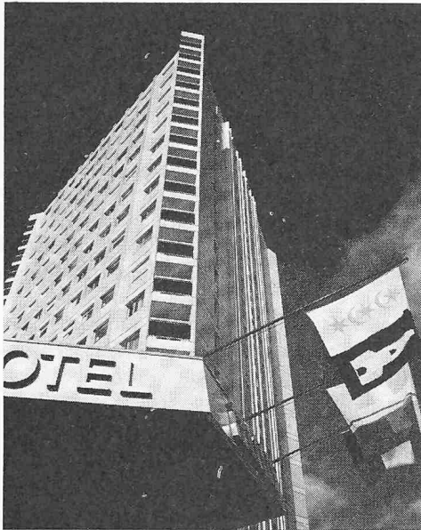
Bild 2. Eurotel in Montreux mit Dalarco-Deckenplatten