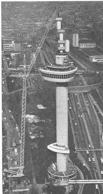
Bild 3. Nach der Montage des neuen Turmes hat der Euromast eine Höhe von 175 m