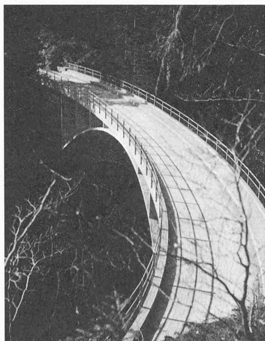
Schwandbachbrücke bei Schwarzenburg, Spannweite 37 m, Grundriss elliptisch. Erbaut 1933