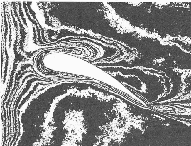
Aufzeichnung von laminaren Strömungen und Turbulenzen an einem Tragflügelprofil

als auch auf turbulente Strömungen von Gasen und Flüssigkeiten. Es ist völlig frei von Verfälschungen durch Sedimentationseffekte. Um die Bahnlinien von Strömungsfeldern sichtbar zu machen, lässt man heute üblicherweise kleine Teilchen mit der Strömung mitwandern. Diese zeichnen dann auf einer Photoplatte bei Dauerbelichtung die Bahnlinien auf. Nachteilig bei diesem Verfahren ist, dass das Eigengewicht der Teilchen nicht ohne Einfluss auf die Aufzeichnung ist. Das neu entwickelte Prinzip vermeidet diese Nachteile; es gestattet auch die Aufzeichnung von Wirbeln, wie im Bild am Modell eines Tragflügelprofils erkennbar. Neben Anwendungen in der allgemeinen Strömungstechnik und in der Luftfahrt lässt sich das Verfahren auch zum Studium von Wärmeübergängen, Erosionen und Staubabscheidungen benutzen. Für hohe Anforderungen empfiehlt sich das Farbaufzeichnungsverfahren, bei welchem Kurven gleicher Grenzschichtdicke auch in der gleichen Farbe wiedergegeben werden. DK 53.087.35:532.517