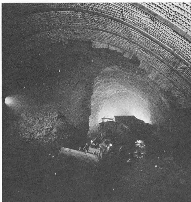
Bild 3. Gotthard-Strassentunnel. Teilausbruch im Bereich der Kreuzung mit dem Bahntunnel

im massigen Aaregranit erreichte, im Gegensatz zum Süden, lediglich eine Menge von 5 bis 10 l/s. Die Betonauskleidung folgt dem Ausbruch und hat den Stand von 647 m erreicht.