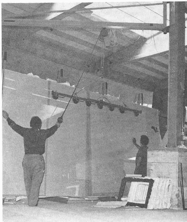
Bild 3. Handhabung grosser Glastafeln mit Kran und Sauger

Die Fabrikhalle besteht aus vier Hallenschiffen, wobei die Arbeits- und Lagerflächen als Rampen ausgebaut sind. Auf die ganze Hallenlänge ist eine Durchfahrt für Lastwagen, Sattelschlepper und Eisenbahnwagen vorhanden