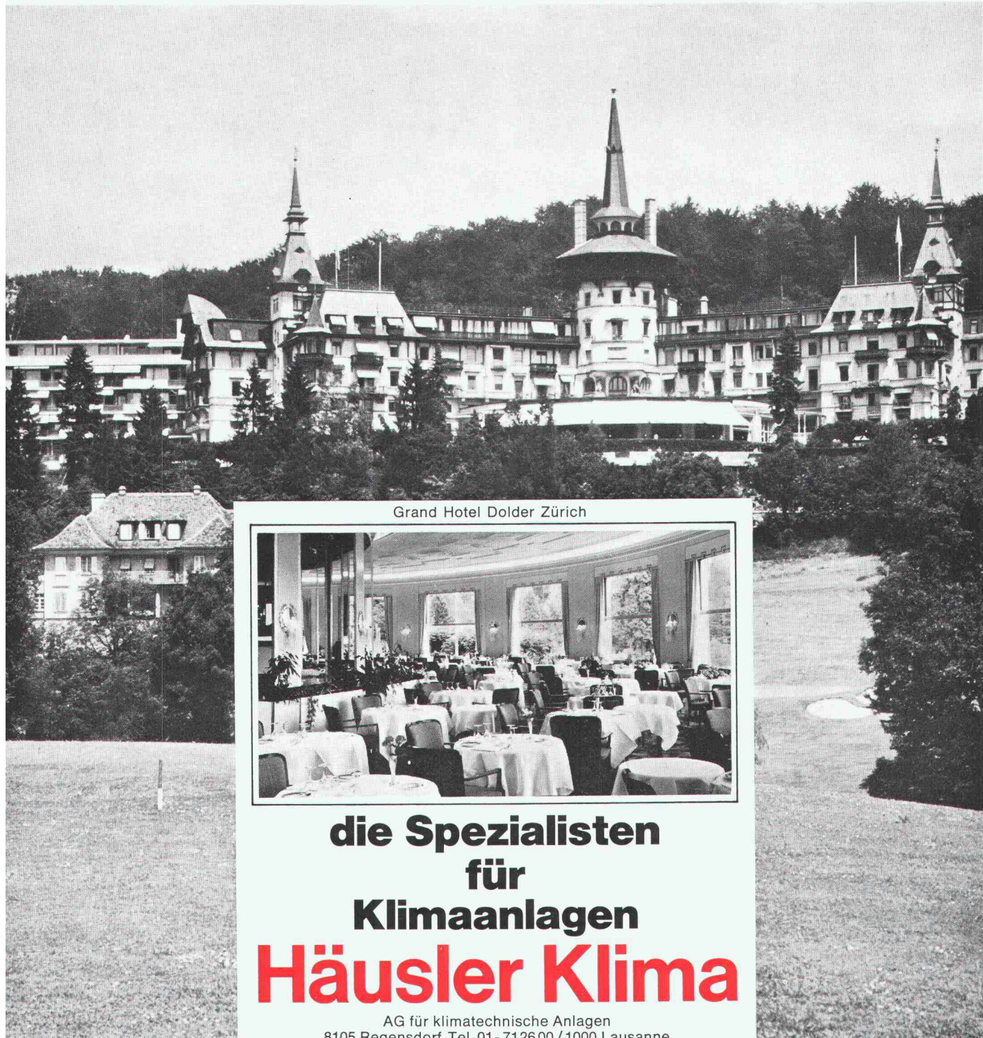
Grand Hotel Dolder Zürich

Herausgegeben von der Verlags-AG der akademischen technischen Vereine, Zürich