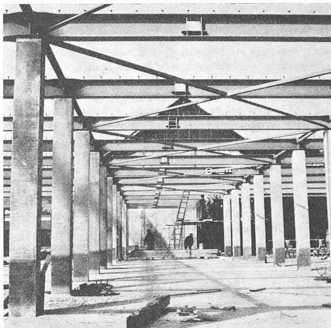
Fig. 3. Les piliers intérieurs en BA préfabriqué

Par cette démarche de l'ingénieur, l'architecte a pu projeter un bâtiment où le bon matériau est engagé à la bonne