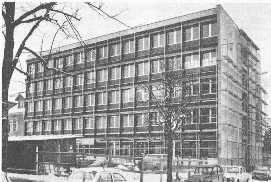
Fig. 1. Vue de la façade sud, 1ère étape