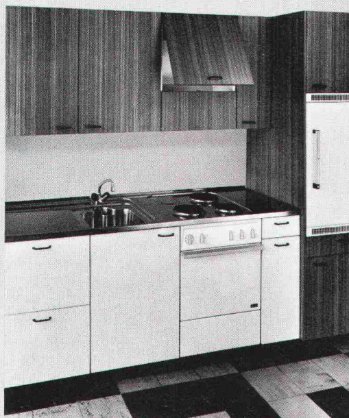
Das ist eine Wernle-Küche. Zum Beispiel.

Wernle hat ein Konzept für den Innenausbau.