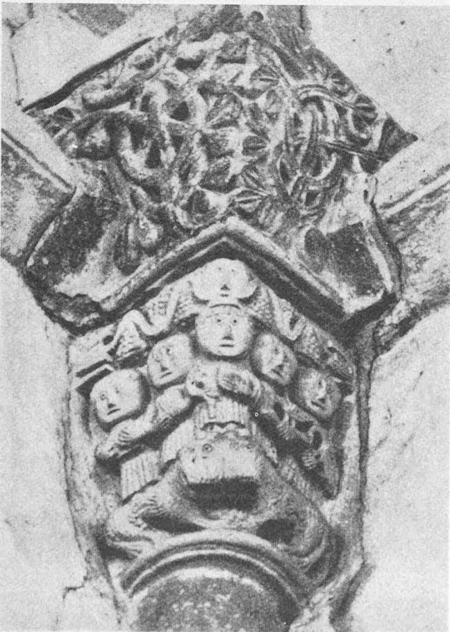
Payerne: Eines der Chorkapitelle (St. Benedict). Kämpfer mit pflanzlichen Motiven

umgangskapitellen von Cluny III – Meisterwerke ihrer Zeit, die stark beschädigt im dortigen Museum erhalten geblieben, aber in Payerne unglaublich roh ausgeführt sind, was in der Nachfolge von Cluny für eine so bedeutende Prioratskirche unvorstellbar wäre. Die Theorie, sie seien nach Maquetten jener Kapitelle, also etwa parallel zu diesen, ausgeführt, hilft auch nicht weiter – und in welchem Material und in welchem Massstab hätte man sich diese Maquetten vorzustellen? Ein Teil der Kapitellplastik scheint für eine der nicht ausgeführten Planvarianten bestimmt gewesen und dann in die endgültige übernommen worden zu sein. Gerne hätte man ein Wort über das seltsame Nebeneinandervorkommen des altertümlichen Bogenfrieses und des westromanischen Konsolengesimses am Äusseren der Hauptapsis gehört, für das der kleinere Schwesterbau von Cluny III, das burgundische Paray-le-Monial, eine (nicht ganz genaue) Parallele bietet. Zum Schluss wird das Verhältnis von Romainmôtier und Payerne zu den anderen, nur als Fragmente erhaltenen Cluniazenserbauten der Westschweiz klargestellt, zu Rüeggisberg, Rougemont, Saint-Sulpice und Münchwiler.