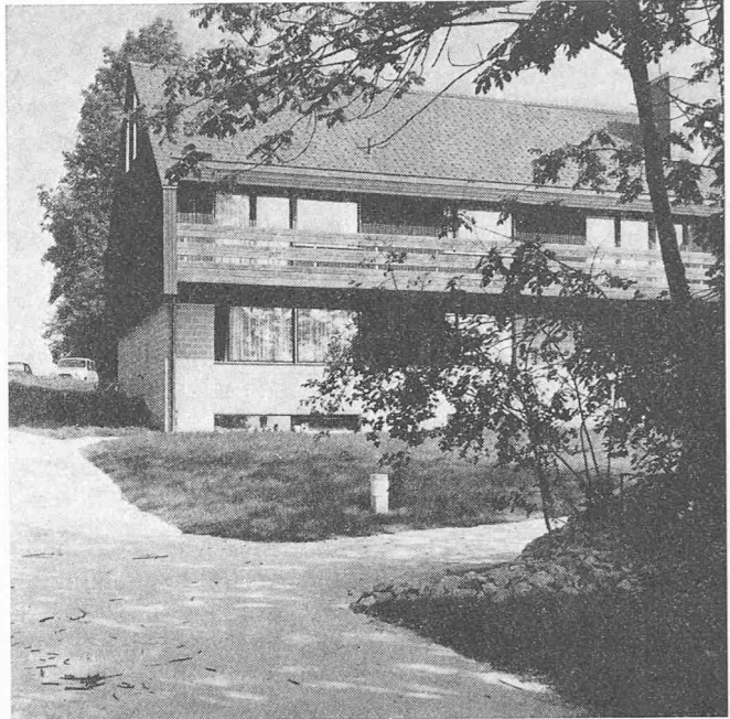
Bild 4. Intensives Naturerlebnis im engsten Wohnbereich trägt bei zur Genesung der entwicklungsgefährdeten Kinder

Bei der Planung des Heimes wurden von den zuständigen Ärzten und Heilpädagogen Anforderungen gestellt, welche für die entwicklungsgefährdeten Kinder von grosser Bedeutung sind. So musste das Heim baulich aufgeteilt werden in zwei Wohnhäuser, ein Schulhaus und ein Nebengebäude mit Einstellmöglichkeiten. Die Wohngemeinschaften bestehen aus je neun Kindern mit 3 oder 4 Pflegepersonen, die zusammen in familienähnlichem Kreise gemeinsam ein solches Haus bewohnen. Für die Gestaltung der Bauten wurden an den Architekten weitere wichtige Anforderungen gestellt, welche für diese entwicklungsgefährdeten Kinder von grosser Bedeutung sind: so z.B. das Erlebnis des grossen schützenden Daches, die zentrale, offene Feuerstelle, die Anwendung natürlicher Baumaterialien. Weiter musste versucht werden, trotz der erforderlichen Trennung die Wohnhäuser und die Schule in ihrer Ausdrucksform als Einheit zu gestalten, damit sich die Kinder im ganzen Schulheim geborgen und zu Hause fühlen können. Eine wichtige weitere Bedingung war, das ganze