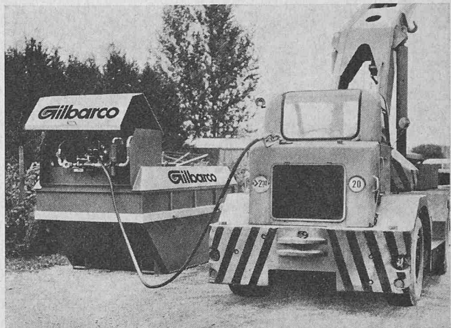
Transportable Tankanlage für Diesel- und Heizöl

Die nach neuesten Erkenntnissen und Vorschriften des Eidg. Amtes für Gewässerschutz gebaute transportable Gilbarco-Tankanlage (System Systa) schafft hier Abhilfe. Bei diesem Tanksystem sind der Öltank (in den Grössen 1500 l, 3000 l, 6000 l, 9000 l und 12 000 l Inhalt), die Pumpenanlage und sämtliche Armaturen in einer genormten Welaki-Transportmulde eingebaut. Dies ermöglicht eine rasche und kostensparende Verschiebung der kompakten Tankanlage. Zudem bietet dieses neue Tanksystem durch eine Auffangwanne, welche 110 % des Tank-