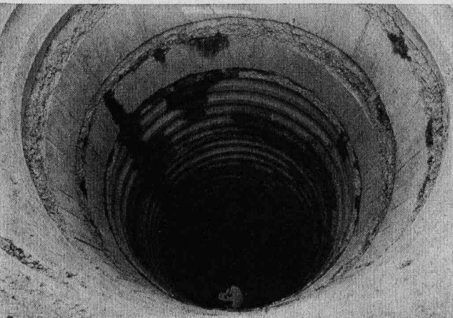
Bild 2. Blick in einen der vier für die Gründung des Pfeilers von Bild 2 etwa 30 m tief abgeteufen Schächte nach der Auskleidung mit Beton

Abschnitten im Freivorbau (Bild 1) als durchlaufende Spannbetonträger auszuführenden Überbauten betragen talseits 58,20 - 104 - 104 - 104 - 51,80 m und bergseits 64,60 - 104 - 98 - 92 - 45,80 m, liegen also zwischen 45 und 104 m. Jeder Überbau hat einen einzelligen 6,80 m breiten Hohlkastenquerschnitt von 5,00 m Höhe über den Pfeilern und 2,20 m in den Feldmitten bei 0,40 m Stegdicke. Die 13,06 m breite Fahrbahnplatte ist 0,22 m dick. Die aus Schwerkriegelmauern mit Schrägflügeln bestehenden Widerlager sind flach auf Felsen und die vier Pfeiler für jeden Überbau auf je vier Schächten von 2,40 oder 3,00 m Innendurchmesser mit einem gegenseitigen Abstand von 8,00 m gegründet. Sie reichen in 15,00 bis 30,00 m Tiefe, wo der anstehende Grund 10 kp/cm 2 Bodenpressung aufnimmt. Die oben mit Betongelenken ausgestatteten Pfeiler sind 13,00; 49,00; 19,20 bzw. 2,50 m hoch. Sie bestehen aus je zwei wandartigen Stützen mit Hohlkastenquerschnitt von 6,80 x 1,80 bzw. innen 5,20 x 1,20 m Grösse und sind mit Gleitschalung betoniert. Lediglich die beiden kürzesten Pfeiler haben Vollquerschnitt und bilden die festen Widerlager der Überbauten.