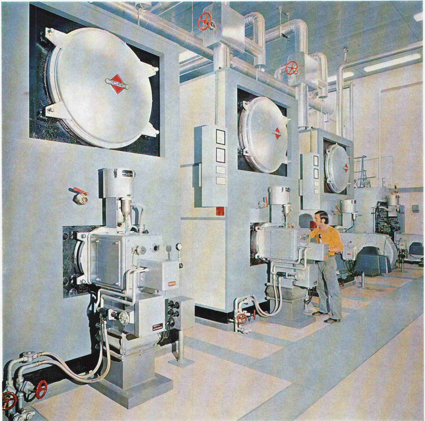
Bürgerspital Solothurn, Heisswasseranlage, 180 °C, 13 atü: 2 Kessel 4 Mio Kcal/h, 1 Kessel 3 Mio Kcal/h, 1 Kessel 2 t HDD, 13 atü