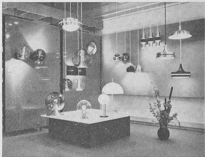
Blick in den « raak »-Ausstellungsraum im Novelectric-Lichtzentrum in Buchs

Das Unternehmen wurde im Jahre 1956 von Carel Lockhorn in Amsterdam gegründet und produziert heute in verschiedenen Ländern in eigenen Fabriken. Das Unternehmen, das allein in Europa über mehr als 60 Ausstellungsräume verfügt und auch in Übersee bemerkenswerte Erfolge verzeichnen konnte, verdankt seinen steilen Aufstieg vor allem zwei konsequent verwirklichten Grundsätzen: erstens nicht einfach Leuchten sondern Licht zu