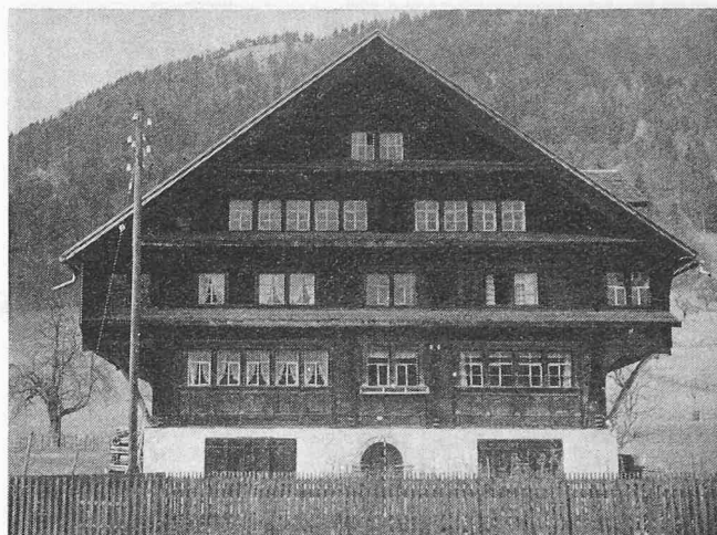
Bauernhaus Familie Nef in Brunadern (datiert 1672)

Die Photographie erfasst in einem Sekundenbruchteil alle optischen Eindrücke, welche das menschliche Auge aus der gleichen Distanz wahrnimmt, und die Auswertetechnik erlaubt deren massstabgetreue Reproduktion. Wie weit die Darstellung von Einzelheiten getrieben werden soll, hängt von der gestellten Aufgabe ab. Detailreichtum und Genauigkeitsstufe sind die Elemente, welche die Höhe der Kosten von der