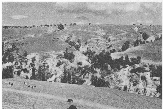
Bild 1. Der Mensch wollte dem Wald durch Rodungen Kulturland abringen. Dabei verschwand das bodenbindende Wurzelwerk. Eine extensive landwirtschaftliche Nutzung gibt den nun gefährdeten Boden der Erosion preis. Ohne sanierendes Eingreifen des Menschen degradieren die Flächen zu vollständig unproduktivem Land