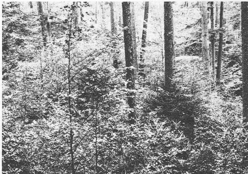
Bild 4, links. Mischbestände mit vorwiegend Laubholz sind im Wechsel der Jahreszeiten in Farben und Formen besonders reizvoll und üben dadurch auf den heutigen Menschen eine starke Anziehung aus