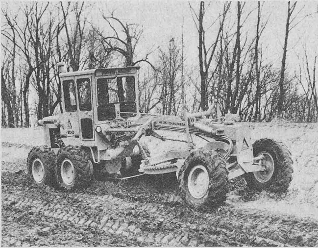
Allis-Chalmers Motor Graders M-100, Serie C

anatomisch geformter verstellbarer Rückenlehne, praktische Anordnung der Pedale, auch für stehende Bedienung, ohne Kraftaufwand zu betätigende, nicht nachzustellende Kontrollhebel für die diversen Arbeitsgänge und grosses Schliessfach unter dem Sitz.