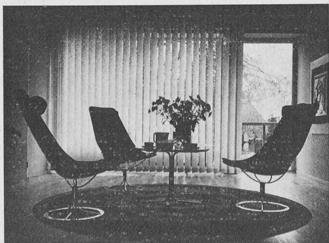
Louverdrappe als Gestaltungselement

Einzel-Anlagen sind bis zu 600 cm Breite und 400 cm Höhe möglich. Bei längeren Fensterfronten werden Anlagen fugenlos aneinandergereiht. Der Lamellen-Vorhang lässt sich von links oder rechts oder von beiden Seiten mit Schnurzug bedienen.