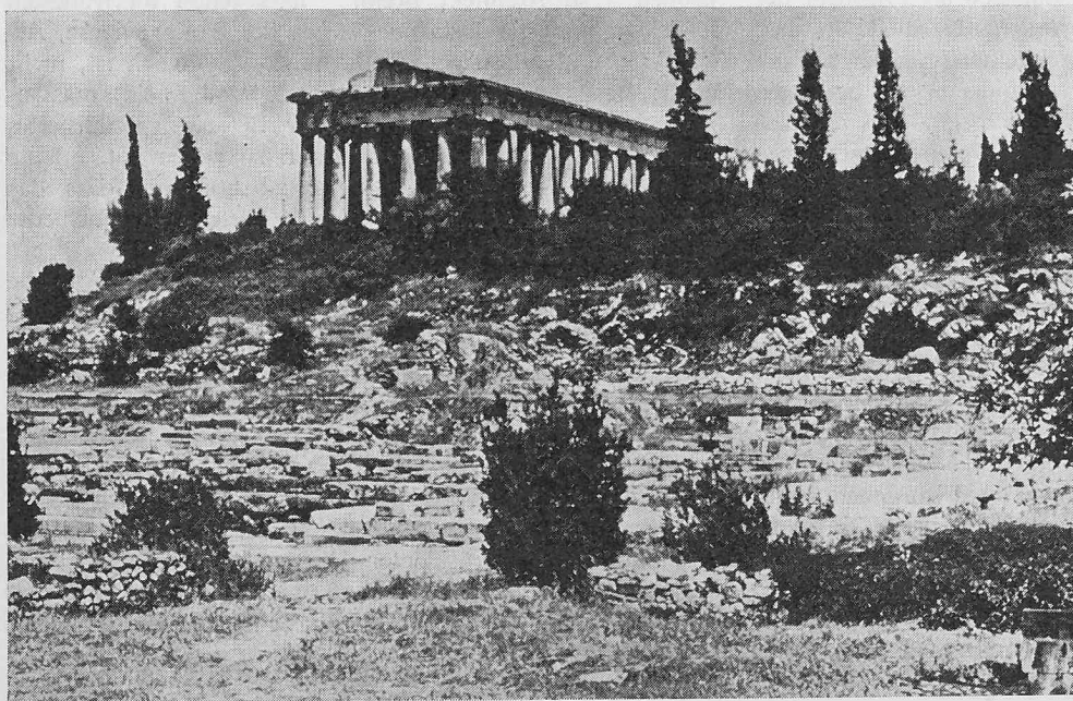
Der griechische Tempel

17 Bilder aus dem Zeitalter der exakten Wissenschaft, das im 19. Jahrhundert anbrach und aus der die moderne Bautechnik hervorgegangen ist, veranschaulichen den Gedankengang des Referenten bis in unsere Gegenwart, angereichert mit würzigen Sentenzen, wie es baslerischer Eigenart