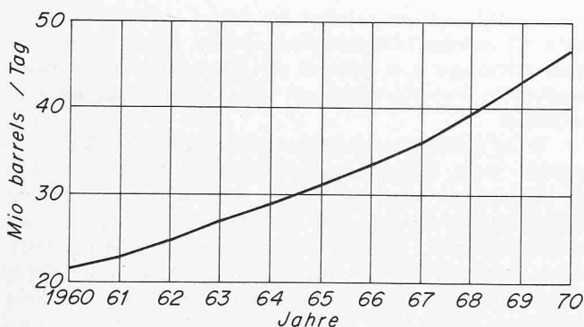
Bild 1. Wachstum der Ölnachfrage von 1960 bis 1970. Durchschnittliche jährliche Zuwachsrate 8%

Bild 1 zeigt, wie der Verbrauch zwischen 1960 und 1970 jährlich um 8% angestiegen ist, entsprechend einer Verdoppelung in weniger als 9 Jahren. Im Jahr 1972 betrug der Weltverbrauch etwa 50 Mio Barrel/Tag (1 Barrel = rund 159 l); selbst bei einer jährlichen Zunahme von nur 6% wäre er bis 1985 auf mehr als 100 Mio Barrel/Tag angestiegen. Etwa 75% davon hätten aus den OPEC-Ländern importiert werden müssen. Bei einem bescheidenen Preis von 6 $/Barrel