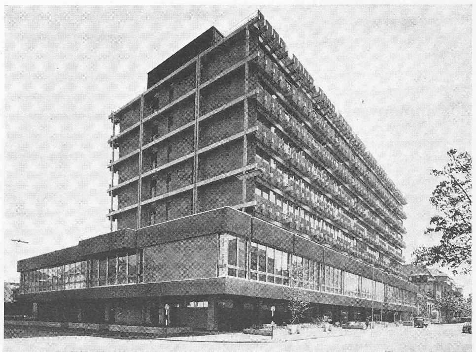
Bild 2. Biozentrum für die Universität Basel

Angesichts des hohen inneren Wertes eines Forschungsgebäudes ist es besonders bedeutsam, dass die Haut bauphysikalisch einwandfrei gestaltet ist. Bei den festen Fassadenteilen soll der k -Wert 0,5 bis 0,6 nicht überschreiten. Der einwandfreien Beschattung aller Glasflächen ist grösste Bedeutung beizumessen.