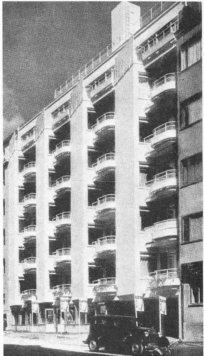
Das Kollektivhaus von Architekt Sven Markelius an der John Ericsonsgatan im Zentrum Stockholms (1935)

Mit der wachsenden Emanzipation der Frau ergaben sich für den frühen Kollektivhausbau in Schweden bedeutsame und in ihrer Tragweite nicht vorauszusehende soziale und ökonomische Folgeerscheinungen.